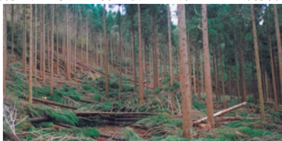
間伐実施後の分収造林地