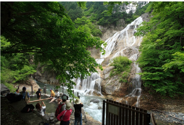
姥ヶ滝（日本の滝100選）

その他に、地元関係者等も「林道ウォーク」等各種イベントを開催し、白山スーパー林道の周知と魅力のアピールに努めることとしておりますので、観光旅行等でのご利用をお願い致します。