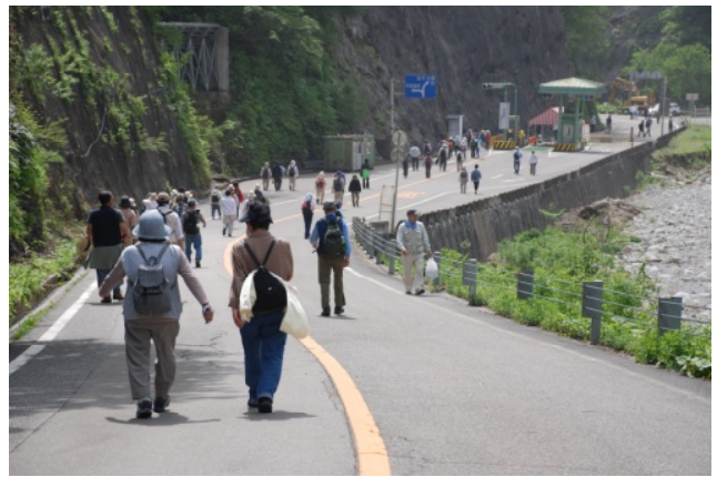
新緑の林道ウォーク