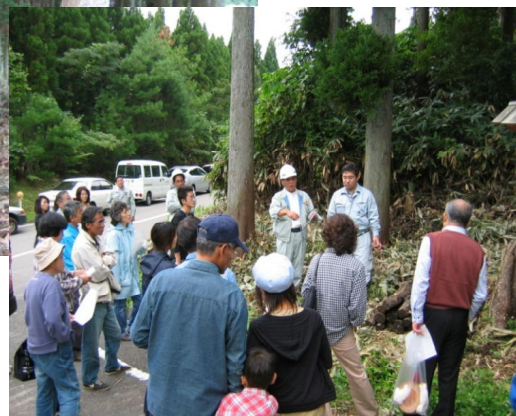
分収育林地「笠島の森」